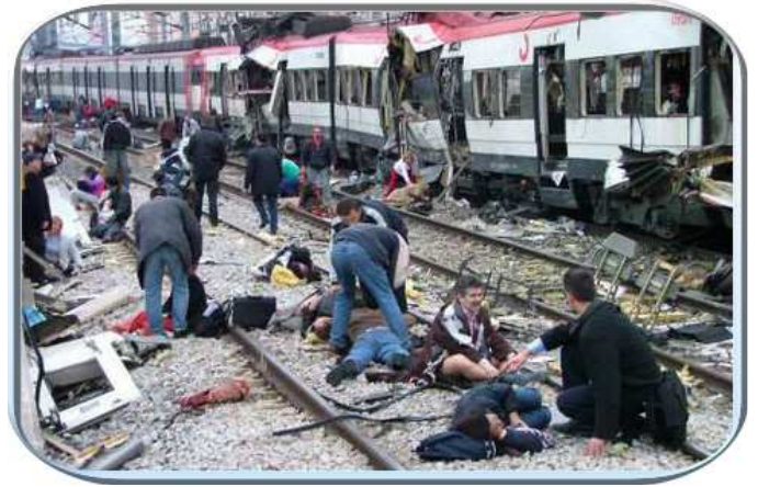
♦ Attentat islamiste en gare d'Atocha, à Madrid (11 mars 2004). Les mensonges « antiracistes » d'Aznar allaient provoquer sa défaite électorale.

réalité lorsque celle-ci déplaît à un quarteron de politiciens ivres d'angélisme ?