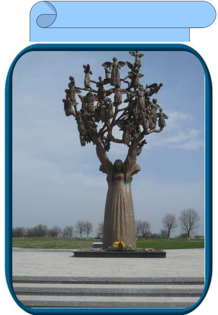
L'arbre du chagrin

Le 1er septembre 2004, un commando terroriste de musulmans radicaux prenait en otages les 1 300 élèves d'une école primaire de Beslan, ville d'Ossétie du Nord (Fédération de Russie). Un carnage s'ensuivit : l'opération revendiquée par Chamil Bassaïev, chef de guerre tchéchène, fit 700 blessés et 365 morts – dont 185 enfants.